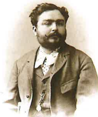
Isaac Albéniz al voltant de 1900.