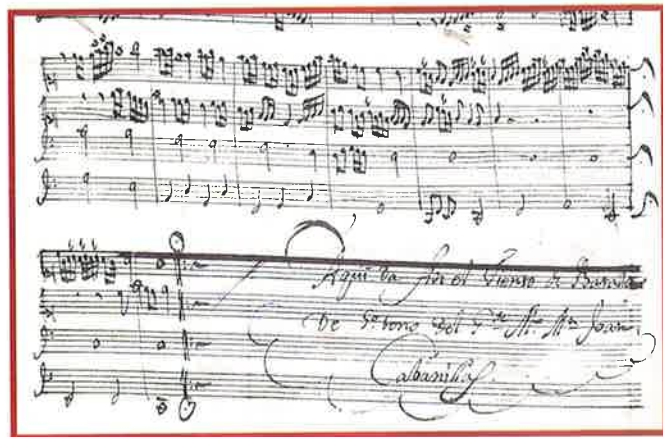
Fragment final d'un Tiento de batalla, de 5è to de Joan Baptista Cabanilles, on s'aprecia la signatura de l'autor.