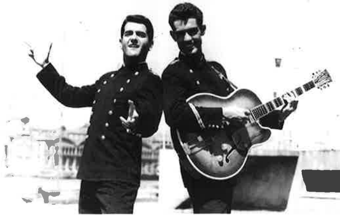
Fotograma de Botón de ancla (Miguel Lluch, 1960) amb els seus protagonistes, el Dúo Dinámico.