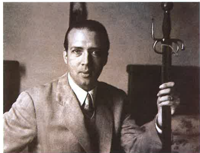
Retrat de Juan Eduardo Cirlot, dedicat a Leopoldo María Panero.