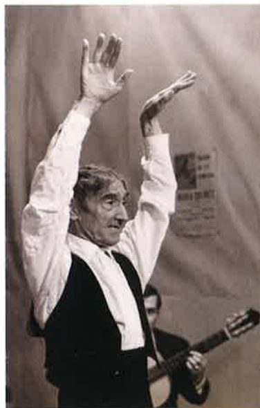
Vicente Escudero en un fotograma de la pel·lícula Con el viento solano (Mario Camus, 1965).

Escudero Uribe, Vicente. Bailaor i ballarí de clàssic espanyol (Valladolid 1885 - Barcelona 1980). Es va iniciar en espectacles ambulants amb els seus pares i ben aviat va anar a París per treballar en restaurants i ballar al Teatre París, a Bucarest, Alemanya, Rússia, Anglaterra, Turquia i Itàlia, on va residir durant la guerra. El 1921 va guanyar el Concurs Internacional de Dansa del Teatre de la Comèdia de París, va debutar a l'Olympia, el 1922 va actuar a la Sala Gaveau amb la parella Carito i el 1931 a la Pleyel. També va impartir classes a l'antic cabaret Chat Noir, convertit en l'Academia de Baile Español. El mateix any va participar a l'hipòdrom de Londres en una vetllada en memòria d'Ana Pavlova. A finals de la dècada dels