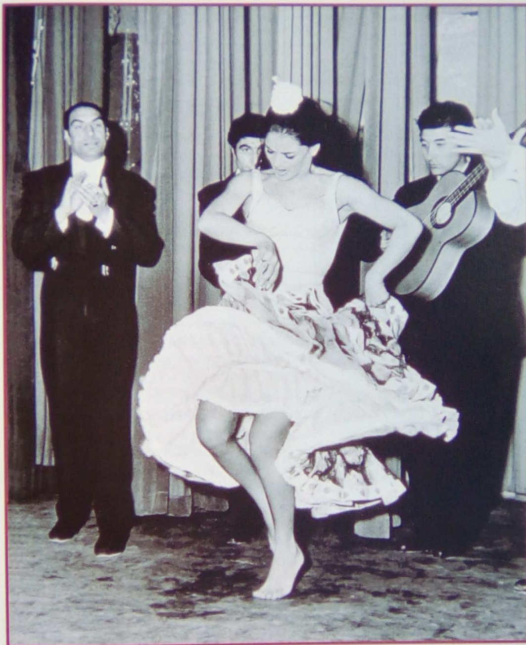
Micaela Flores Amaya «La Chunga» amb el seu cuadro flamenco als anys seixanta, on destaca el guitarrista català Pepe Pubill. El seu ball, que es caracteritza per la passió i la particularitat de ballar descalça, l'ha portat a ser una de les artistes flamenques més internacionals, i va arribar a ballar el 14 de gener de 1965 al Palau de la UNESCO a la seu de París.