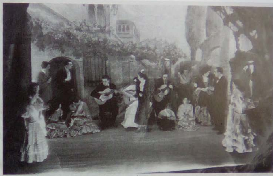
Actuació d'un cuadro flamenco al Teatre La Violeta de Lleida a principis del segle XX (Arxiu de la família Parrano).

D'una banda, la línia purista del flamenc ha tingut el seu marc idoni en els espais flamenques, en els primers cafés cantantes i els teatres, fruit d'una transculturització accentuada, i que es perpetua fins al dia d'avui en les peñas flamenques i els tablaos . De l'altra, el flamenc ha entrat a formar part de la música popular urbana, s'ha introduït en el mercat discogràfic i ha utilitzat els nous mitjans de difusió com el cinema i la ràdio per incorporar-se posteriorment en la postmodernitat amb les fusions. Així es pot seguir l'evolució del flamenc